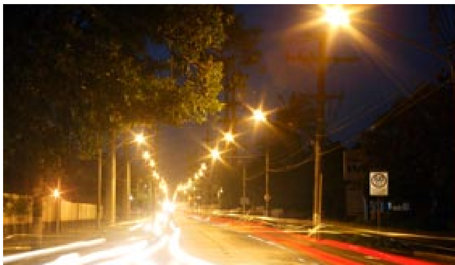
Rua de Joinville (SC) - Projeto: Consórcio Sadenco/Quantum/Enerconsult;

• ampliar a manutenção corretiva e preventiva do sistema de iluminação pública, visando garantir o funcionamento, os parâmetros